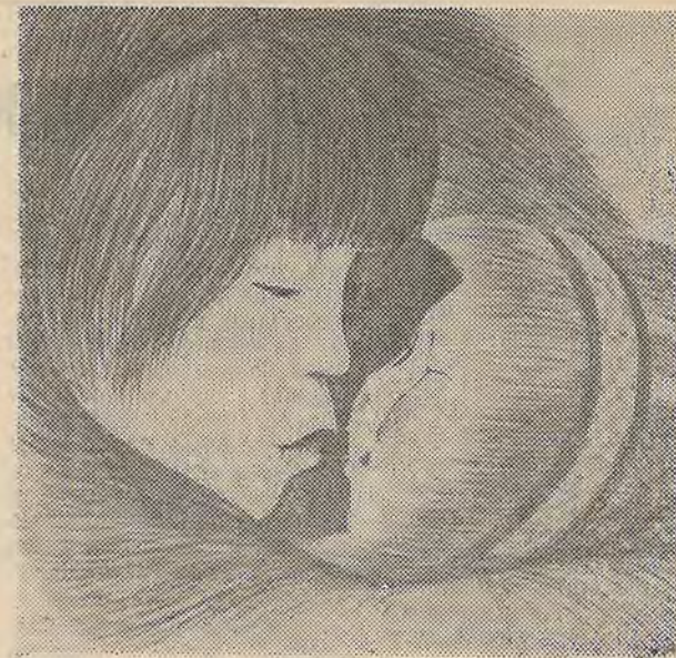
«Самые счастливые». Литография.

Пьеса «Добрый человек из Сезуана» дважды ставилась у нас в стране: Те-