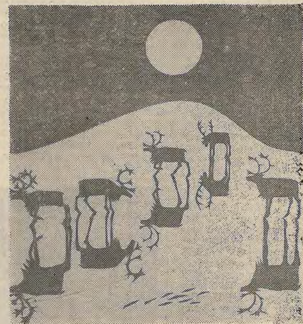
«Лунная ночь». Аппликация.

День от солнца берет начало, Вот плывет оно красным стругом... Солнце тундры лицо ласкает И ласкает речные струи. Здравствуй, день! Твоего веселья Хватит нам на целое лето!.. А оленьих рогов ожерелья Чуть позванивают под ветром.